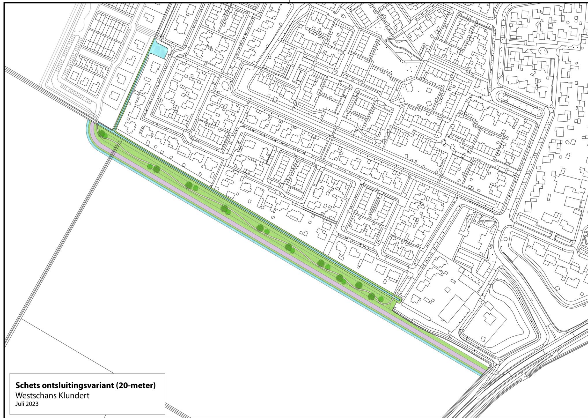
Schets ontsluitingsvariant (20-meter) Westschans Klundert Juli 2023