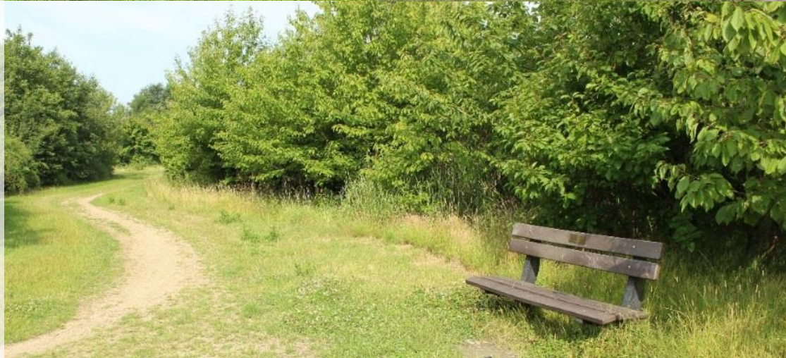
stopplek / toegangen