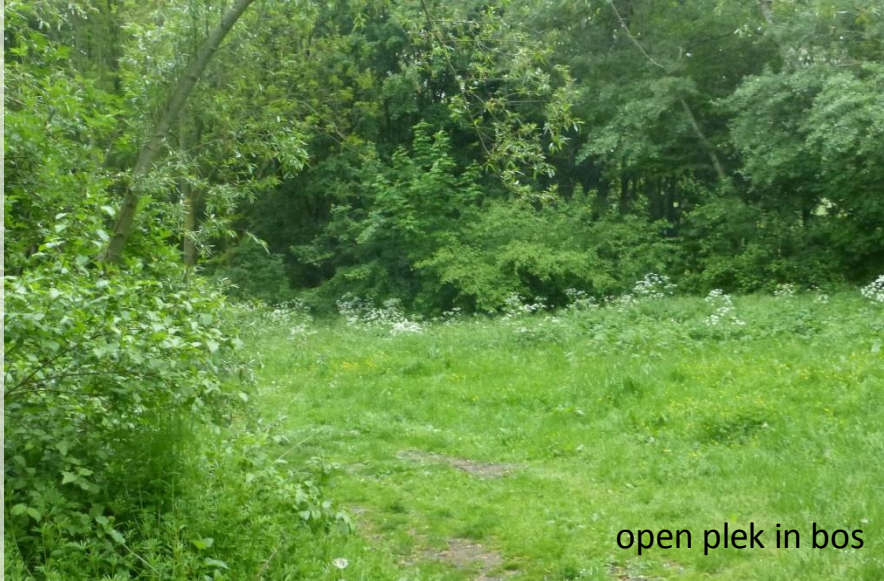
open plek in bos