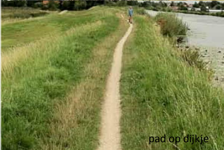
pad op dijkje