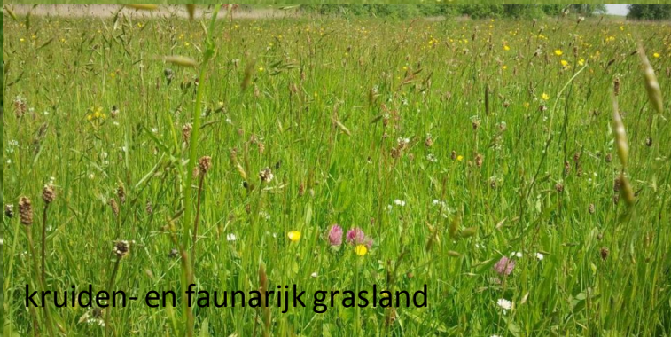
kruident- en faunarijk grasland