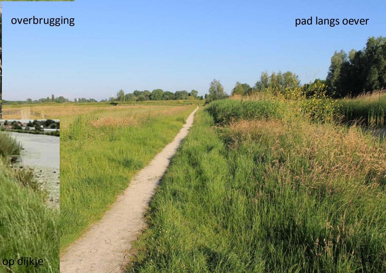
pad langs oever