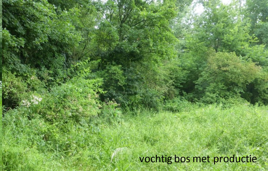
vochtig bos met productie