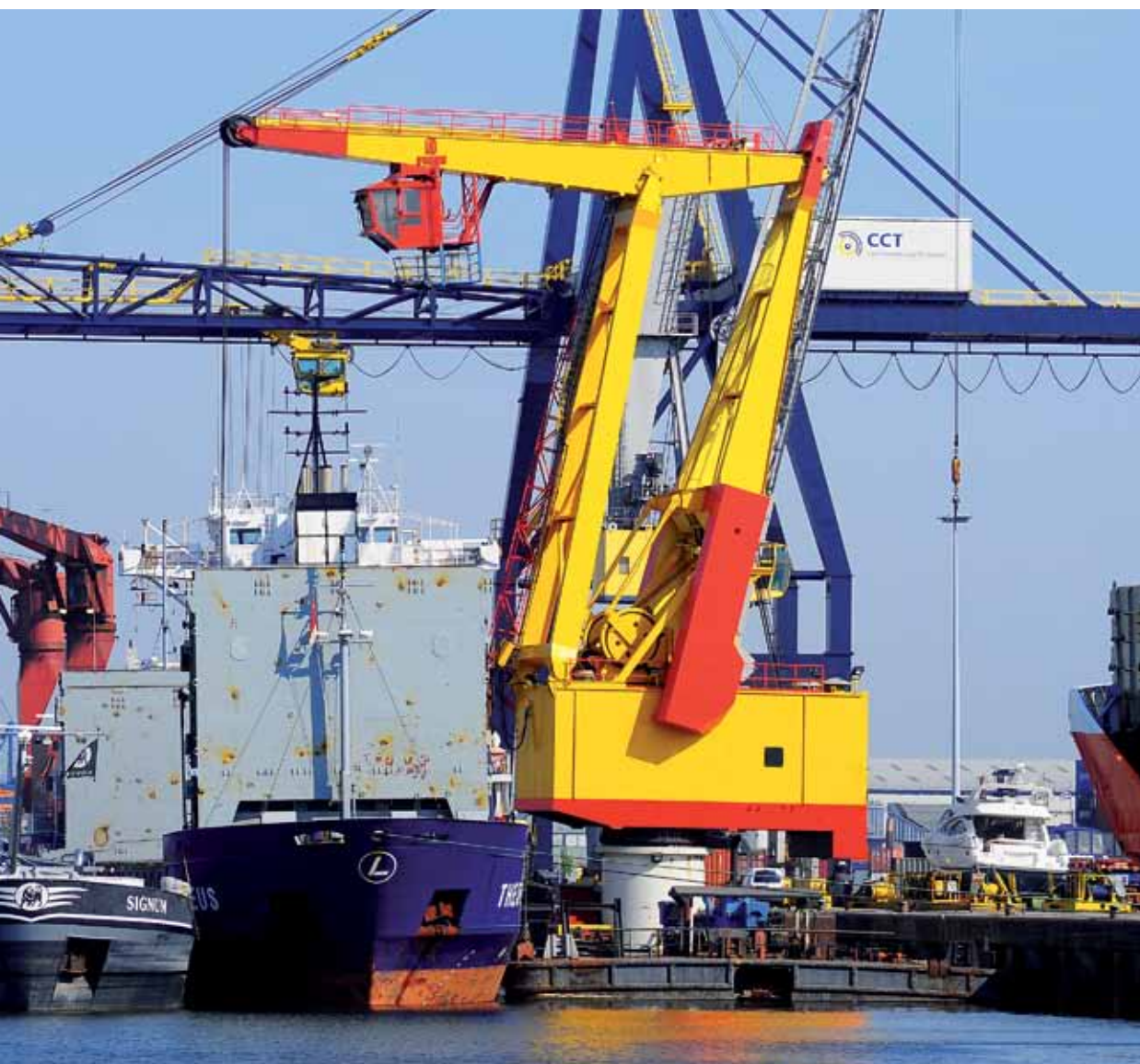
Spil van het hoogwaardig logistiek- en industrieel knooppunt in de gemeente Moerdijk is Zeehaven- en Industrierrein Moerdijk.