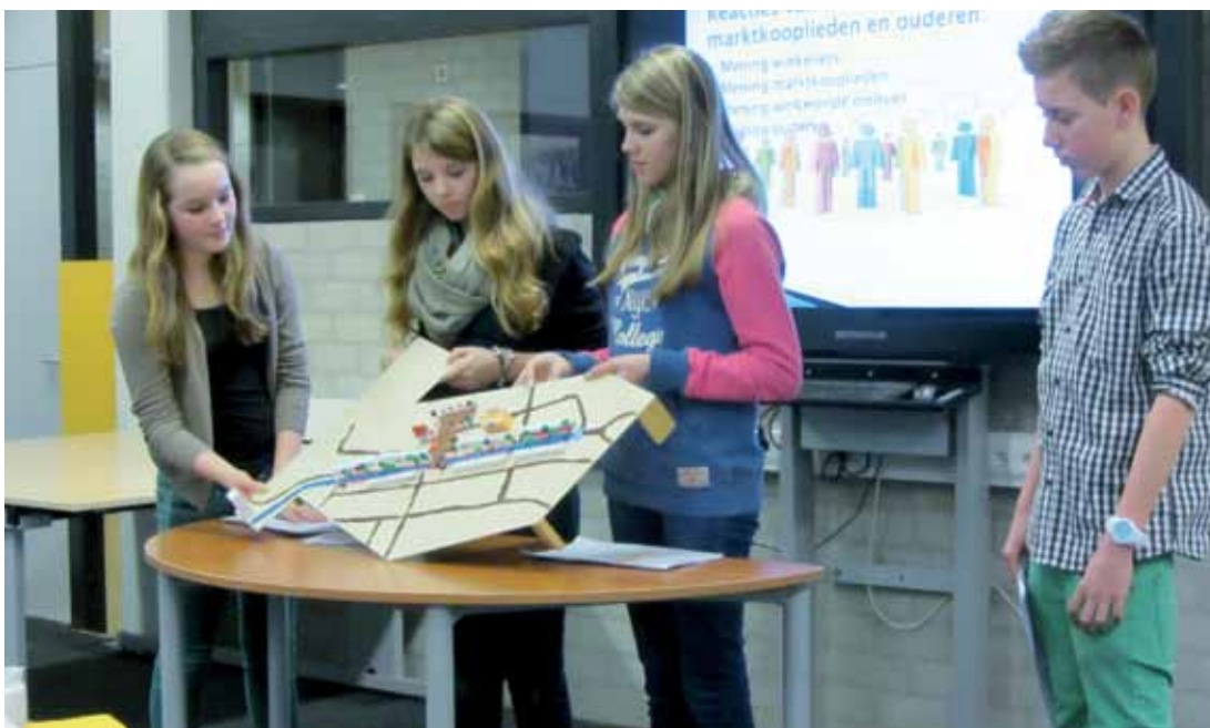
Scholieren denken mee over de toekomst van het centrum van Zevenbergen.