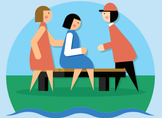
Sterke sociale structuur

Om deze kernwaarden voor leefbaarheid te beschermen zijn wij met elkaar gekomen tot de volgende voorwaarden: