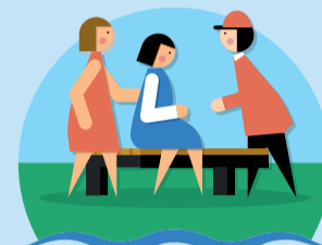
Sterke sociale structuur

Om deze kernwaarden voor leefbaarheid te beschermen zijn wij met elkaar gekomen tot de volgende voorwaarden: